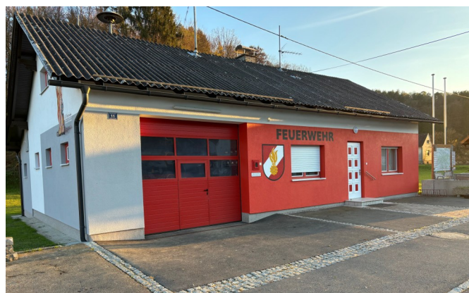
Neue Fassade Feuerwehrhaus Oberdrosen