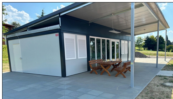
Die neue Tenniskabine in Containerbauweise

Die Fertigstellung der neuen Tenniskabine in Containerbauweise ist ein beeindruckender Zugewinn für das Sportzentrum und wurde bereits beim Doppeltourier erfolgreich in Betrieb genommen. Die Anlage bietet moderne Einrichtungen, darunter getrennte Duschen und WCs für Frauen und Männer, eine voll ausgestattete Küche und einen großen Aufenthaltsraum. Das positive Feedback der Spieler und Zuschauer unterstreicht, wie gut die neue Infrastruktur ankommt. Mit der ganzjährig bespielbaren Tennisanlage, der neuen Tenniskabine, der Multifunktionssportanlage und dem beleuchteten Beachvolleyballplatz ist ein vielfältiges Sportzentrum entstanden. Diese Einrichtungen fördern nicht nur den Sport für Erwachsene, sondern bieten auch Kindern und Jugendlichen ausgezeichnete Möglichkeiten für Bewegung und Freizeit. Ein solches Sportzentrum ist ein wertvoller Ort für die gesamte Gemeinde und stärkt den Zusammenhalt durch gemeinsame sportliche Aktivitäten.