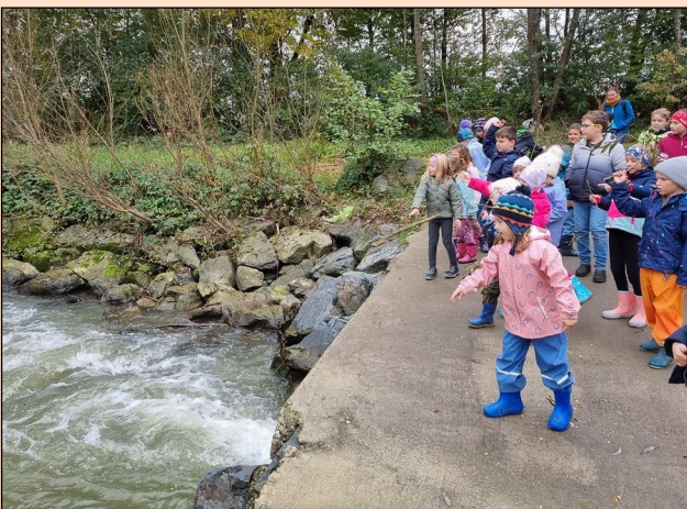
Lernfeld Wasser - Besuch der Raab

Die Josef Reichl Naturparkschule Sankt Martin an der Raab wünscht frohe Weihnachten und ein glückliches neues Jahr!