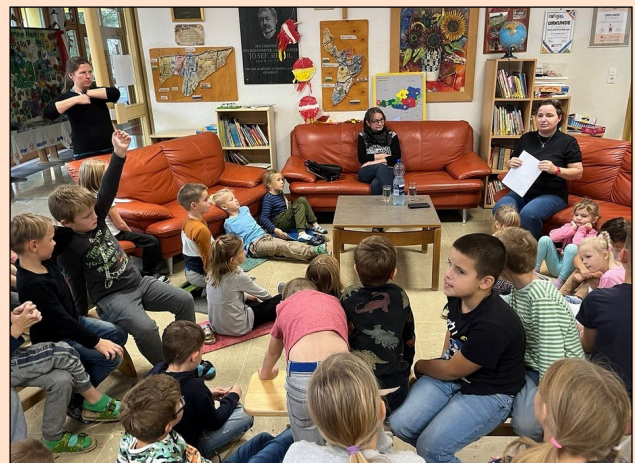
Nationalfeiertag - spannende Erzählungen