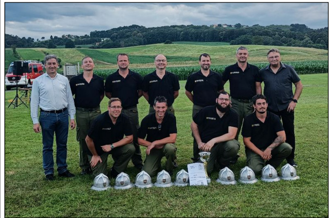
FF Eisenberg an der Raab - Sieger in BRONZE A

72. Feuerwehrball der Freiwilligen Feuerwehr St. Martin an der Raab-Berg am 6. Jänner 2025 in der beheizten Martinihalle. Beginn: 19.00 Uhr, Musik: „TOP 2“