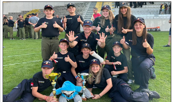
Landesfeuerwehrjugendleistungsabzeichen in Mattersburg