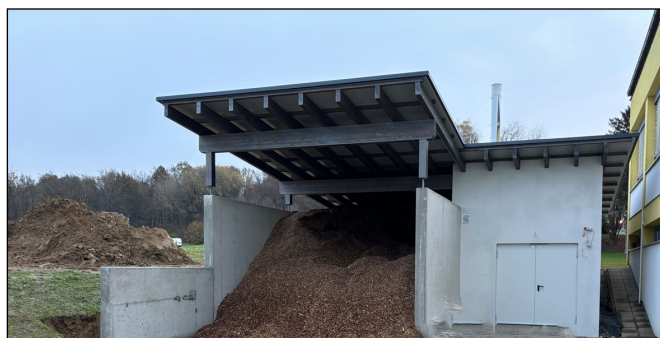
Das Heizhaus bei der Volksschule ist kurz vor der Fertigstellung

Die restlichen Arbeiten am Heizhaus, wie Fassade und Asphaltierungsarbeiten, sollen bis Ende des Jahres abgeschlossen werden, sodass die Anlage bald vollständig fertiggestellt ist.