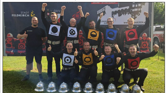
Die erfolgreiche Feuerwehr Sankt Martin an der Raab-Berg Weihnachtsausgabe 2024 OrtSPÖst 3