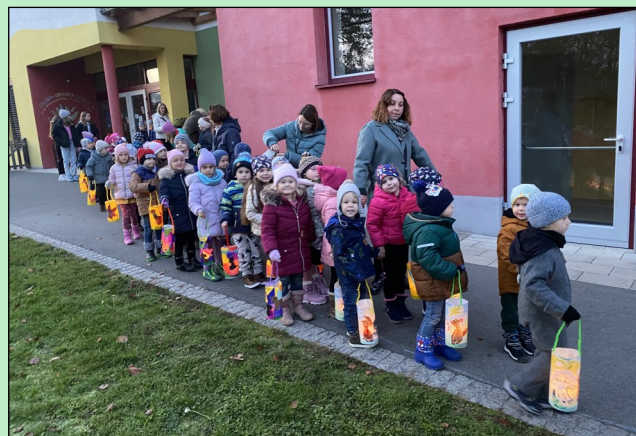
Die Kinder mit ihren Laternen auf dem Weg zur Kirche

In diesem Sinne wünschen wir ALLEN ein besinnliches Weihnachtsfest und ein gesegnetes NEUES JAHR 2025!