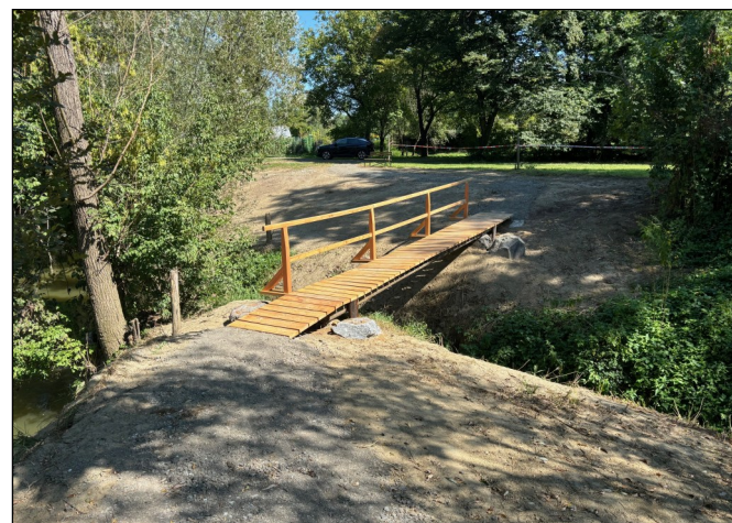
Neuer Steg über dem Mülbach in Neumarkt

Ein friedvolles Weihnachtsfest und einen guten