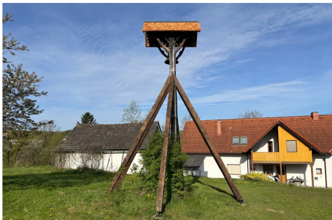
Der neu sanierte Glockenturm in Welten

Der historische Glockenturm neben dem Kommunikationszentrum in Welten erstrahlt nach einer umfassenden Sanierung wieder in neuem Glanz. In enger Abstimmung mit dem Bundesdenkmalamt wurde das Bauwerk von der Firma Holzbau Roposa aus Minihof-Liebau vollständig restauriert. Für die Arbeiten war es notwendig, den gesamten Turm samt Glocke abzubauen. Die fachgerechte Sanierung erfolgte unter Verwendung von hochwertigem Totholz, auf dessen Lieferung mehrere Monate gewartet werden musste. Ein besonderes Augenmerk wurde auch auf das Dach gelegt. Dieses wurde traditionell mit Holzschindeln neu eingedeckt und damit denkmalgerecht erneuert. Die Gesamtkosten für das Projekt beliefen sich auf rund 19.000 Euro . Unterstützt wurde die Maßnahme durch Fördermittel. Sowohl die Kulturabteilung des Landes Burgenland als auch das Bundesdenkmalamt leisteten jeweils einen Beitrag von 3.000,00 bzw. 1.100,00 Euro .