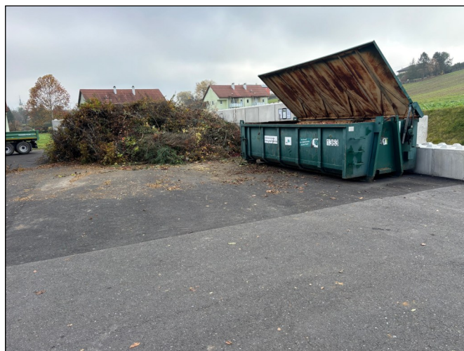
Neuer Grünschnittplatz am Bauhof

Ein friedvolles Weihnachtsfest und einen guten Rutsch wünscht