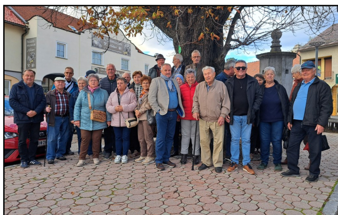
Halbtagesausflug der Pensionisten nach Bernstein

Eigentümer, Herausgeber und Hersteller: SPÖ-Landesorganisation Burgenland, 7000 Eisenstadt, Perlmayerstraße 2. Redaktion: SPÖ-Ortsorganisation der Marktgemeinde St. Martin/Raab. Offenlegung lt. Mediengesetz vom 1.1.1982 §25 Abs.2. Unternehmungsgegenstand ist die Information der Öffentlichkeit. Die SPÖ-Ortsorganisation der Marktgemeinde St. Martin/Raab ist die alleinige Eigentümerin der „ortspöst“. Die grundlegende Richtung entspricht dem Parteiprogramm der SPÖ.