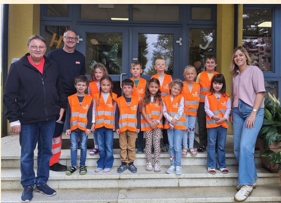
ARBÖ überbringt Warnwesten für die 1. Klasse

Ein herzliches Dankeschön gilt dem Elternverein, allen Schulpartnern, der Marktgemeinde Sankt Martin an der Raab sowie allen, die unsere Arbeit im Herbst 2025 begleitet und bereichert haben. Wir wünschen allen Kindern, Eltern und Freunden unserer Schule ein gesegnetes Weihnachtsfest und ein gesundes, erfolgreiches Jahr 2026.