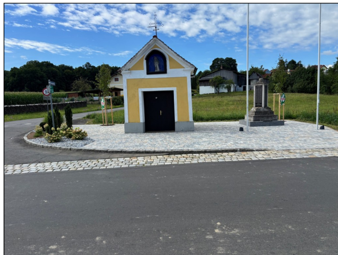
Neuer Vorplatz beim Kriegerdenkmal in Welten