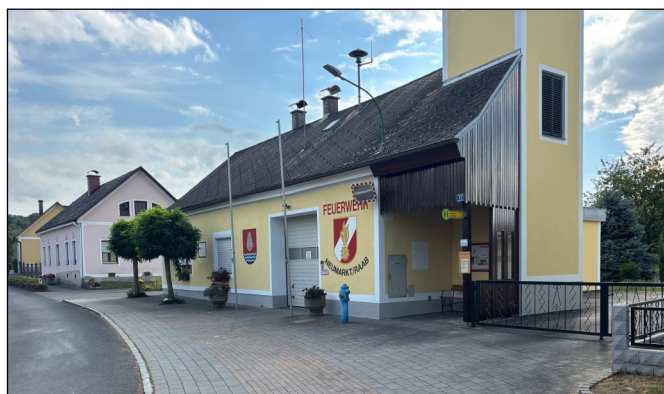
Neue Fassade Feuerwehrhaus Neumarkt an der Raab