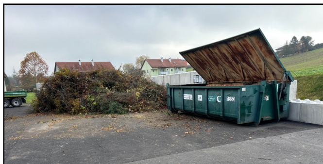
Der neue Grünschnittplatz am Bauhof

Während der Annahmezeiten ist stets ein Bauhofmitarbeiter anwesend, der bei Bedarf unterstützt und für einen reibungslosen Ablauf sorgt. Die Gesamtkosten für den neuen Grünschnittplatz inklusive Einstellplatz beliefen sich auf rund 120.000 Euro . Das Land Burgenland förderte das Projekt mit 100.000 Euro und leistete damit einen wesentlichen Beitrag zur Umsetzung. Mit der neuen Anlage wird die Entsorgung von Grünschnitt für die Bevölkerung deutlich erleichtert und gleichzeitig die Infrastruktur des Bauhofs nachhaltig verbessert. In den Monaten Dezember bis Februar ist der Grünschnittplatz geschlossen.