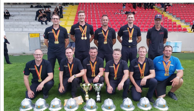
Die erfolgreiche Feuerwehr Sankt Martin an der Raab-Berg Weihnachtsausgabe 2025 OrtSPÖst 3