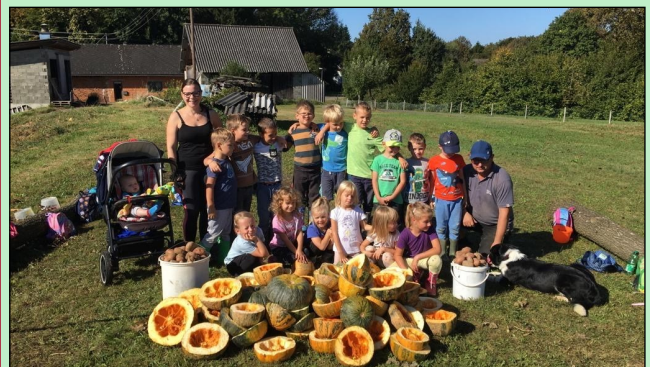
Alle fleißig bei der Kürbis- und Kartoffelernte

Das Team des Kindergartens wünscht allen ein frohes Fest im Kreise der Familie!