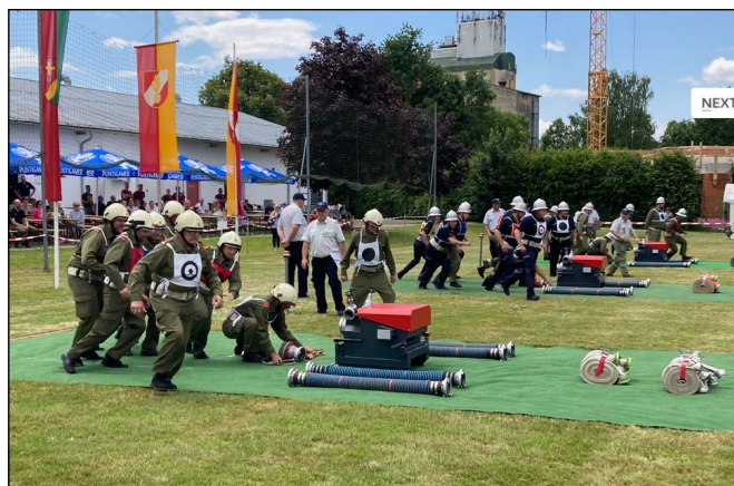
Bezirksbewerb - es wird um jede Sekunde gekämpft

71. Feuerwehrball der Freiwilligen Feuerwehr St. Martin an der Raab-Berg am 6. Jänner 2024 in der beheizten Martinihalle. Beginn: 19.00 Uhr, Musik: „TOP 2“