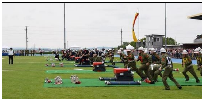
Landesfeuerwehrleistungsbewerb in Eisenstadt