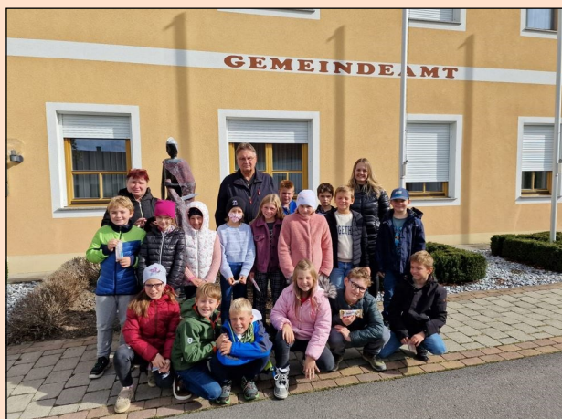
Besuch im Gemeindeamt

Das Team der Josef-Reichl-Naturparkschule dankt allen Kooperationspartnern für die gute Zusammenarbeit und wünscht Ihnen allen ein frohes Weihnachtsfest und für das neue Jahr alles Gute und viel Gesundheit!