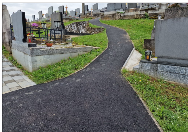
Weitere Teilsanierung der Friedhofswege

Ein friedvolles Weihnachtsfest und einen guten Rutsch ins Jahr 2024 wünscht