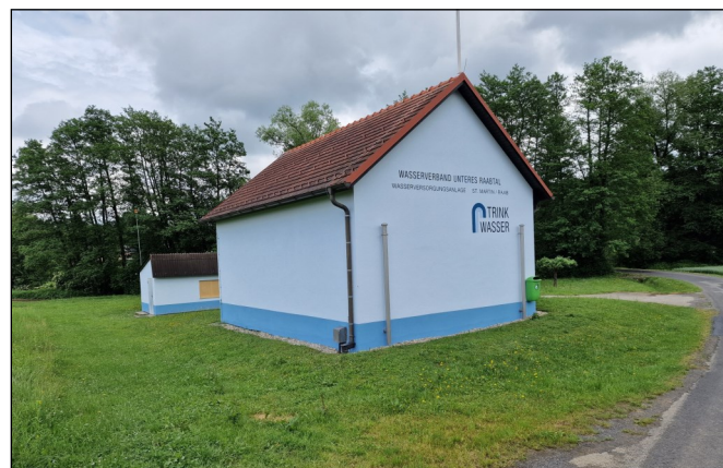
Neue Fassade Wasseraufbereitung Sankt Martin an der Raab