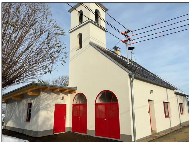
Feuerwehrhaus mit Zubau - Ansicht Südwest