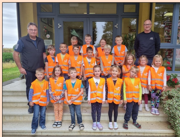
ARBÖ Schutzwesten für die Schulanfänger