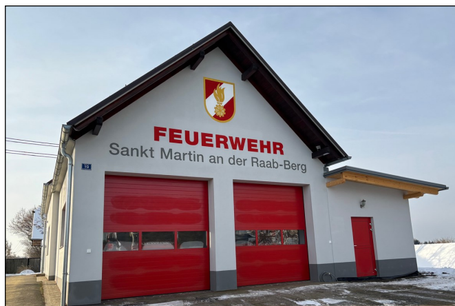
Feuerwehrhaus mit neuer Fassade und Zubau - Ansicht Nordost