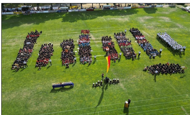
Landesfeuerwehrjugendleistungsbewerb in Gols