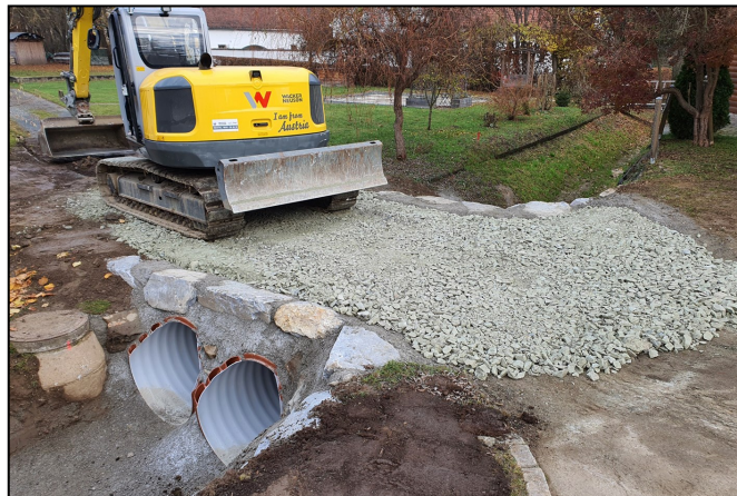
Die neu errichtete Brücke beim Haus Hartinger in Neumarkt

Hauptstr. 8/1, 8380 Jennersdorf T. 03329 45327 F. 03329 46286 E. elektro.brueckler@speed.at