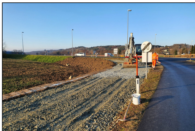
Rad- und Gehweg von St. Martin an der Raab nach Doiber

Fröhliche Weihnachten und viel Erfolg im Jahr 2022 wünscht die