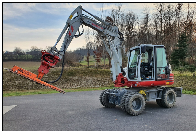
Unser Radbagger mit Astschere